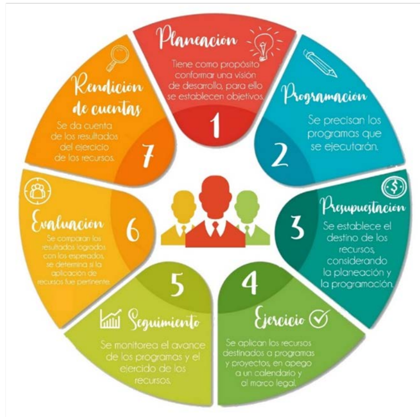
Gráfico 1. Ciclo presupuestario